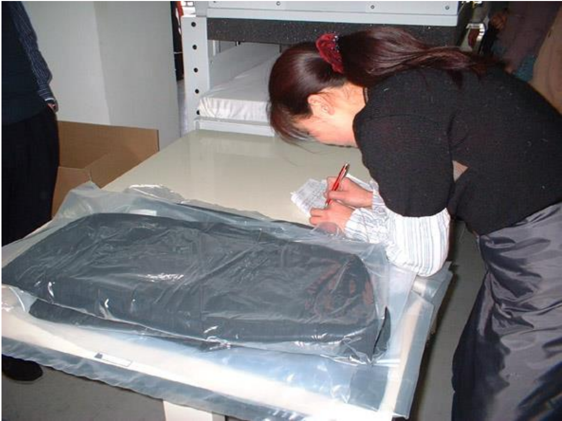
▲▼⑮完成した圧縮パックの整理と伝票チェック