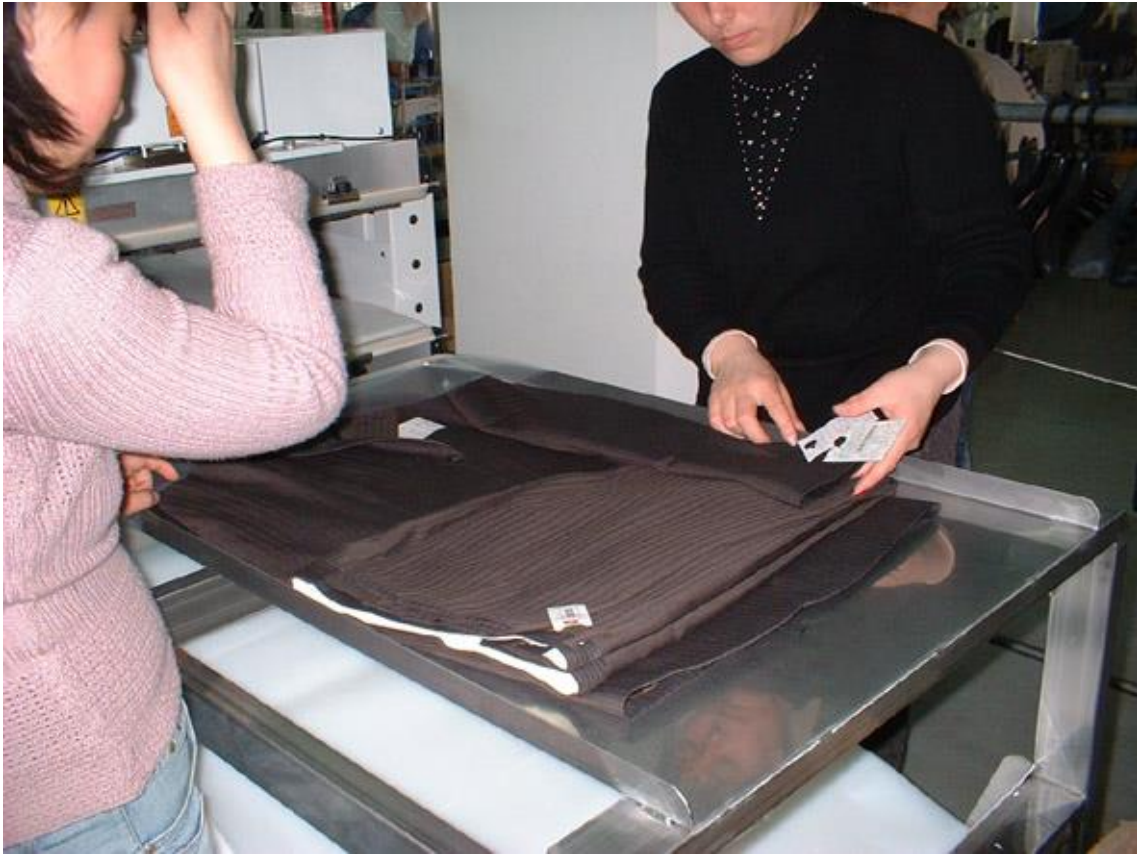
▲⑪上衣の上に熱乾燥処理したパンツをセット