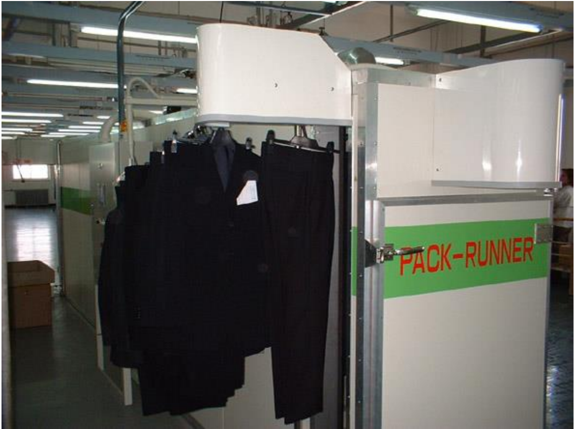
▲⑦製品は順次自動投入⇒熱乾燥処理