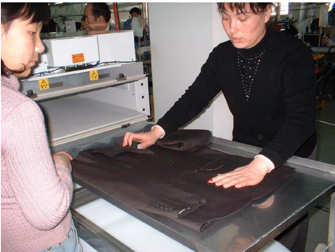
▲⑩自然な状態で上衣をトレイ上で整理・セット