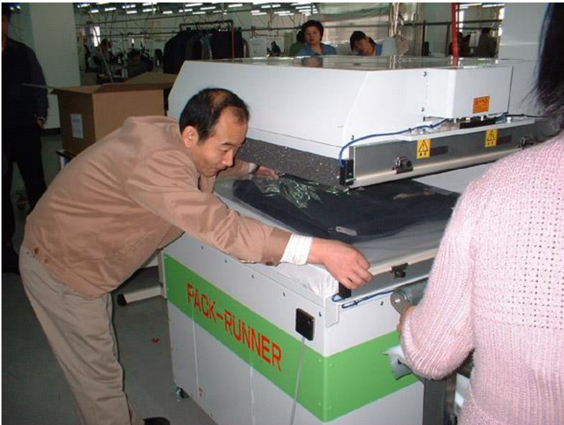
▲⑬圧縮&シール機の下ゴテに防湿フィルムパックをセット