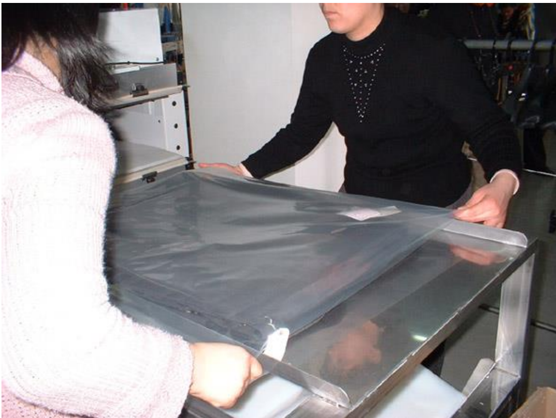
▲⑫トレー上の製品に防湿フィルムを被せる