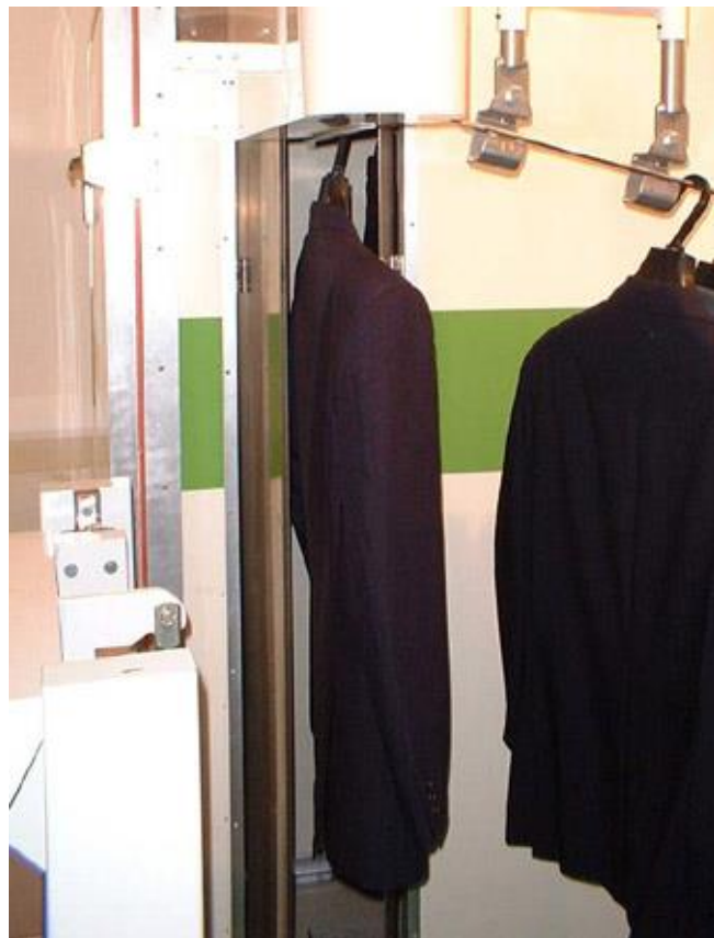
▲⑧熱乾燥処理終了後、製品は順次自動排出