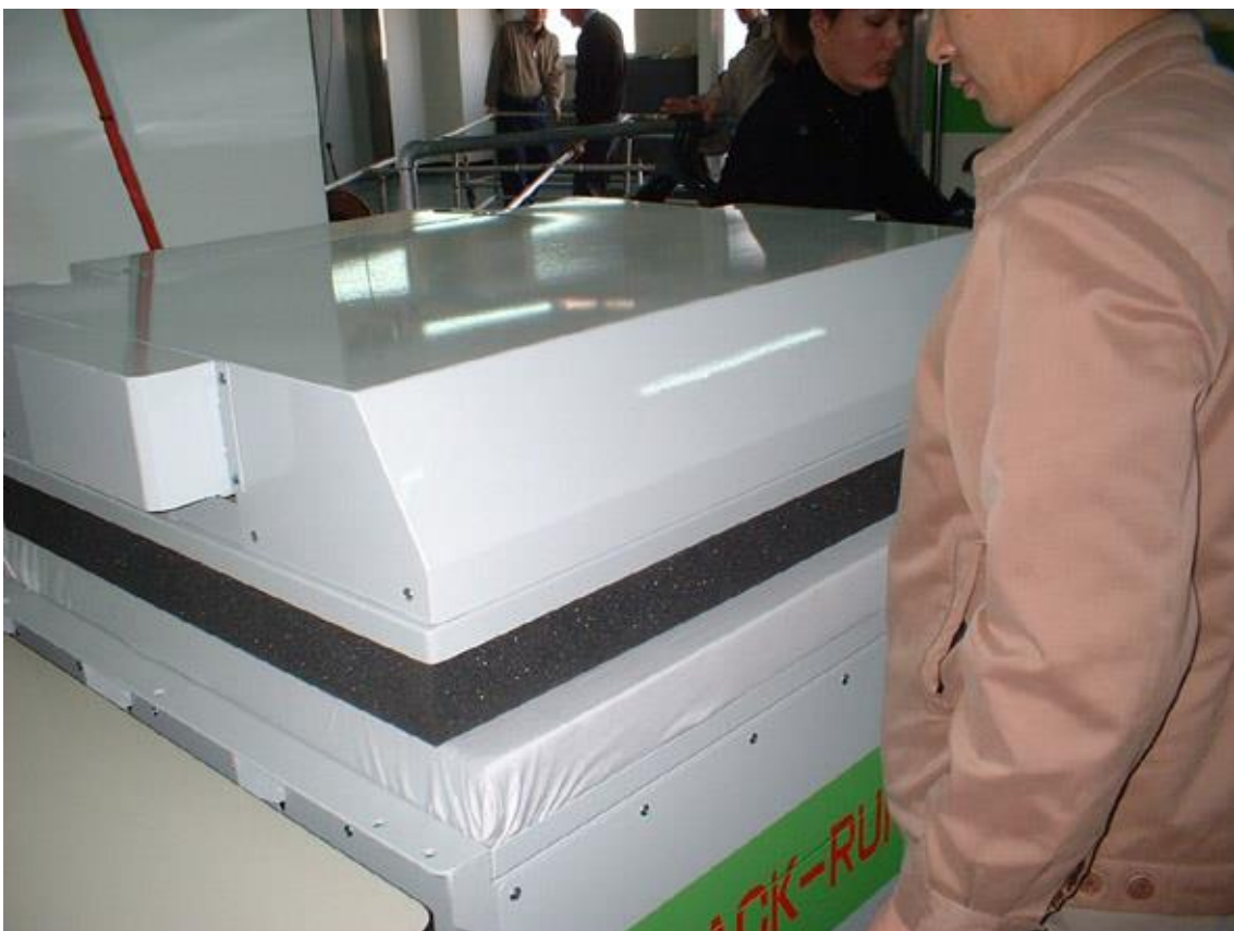
▲⑭タイマー制御により適度な状態で圧縮パックとシール(溶着)