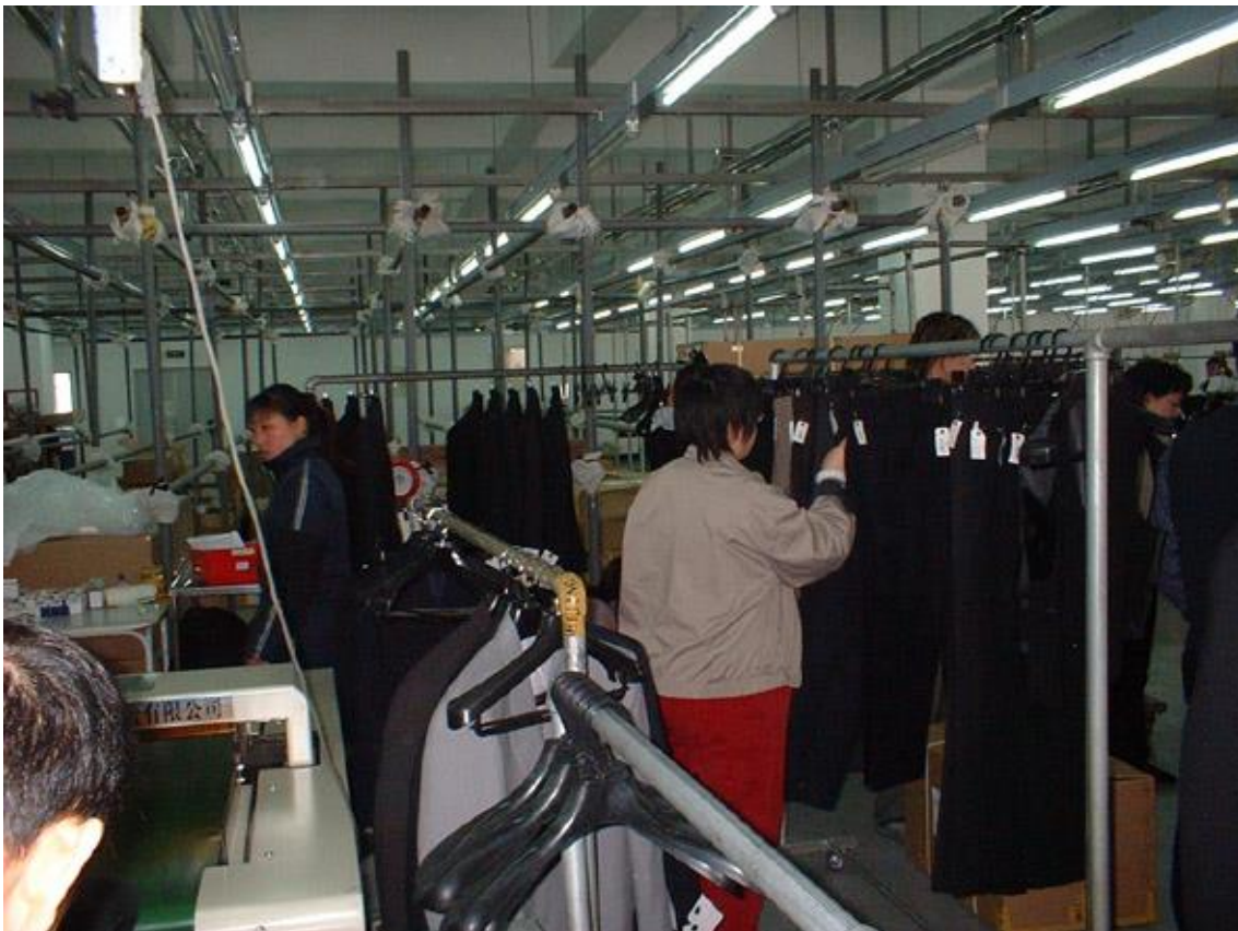
▲①通常の仕上げ処理後、製品を確認・整理