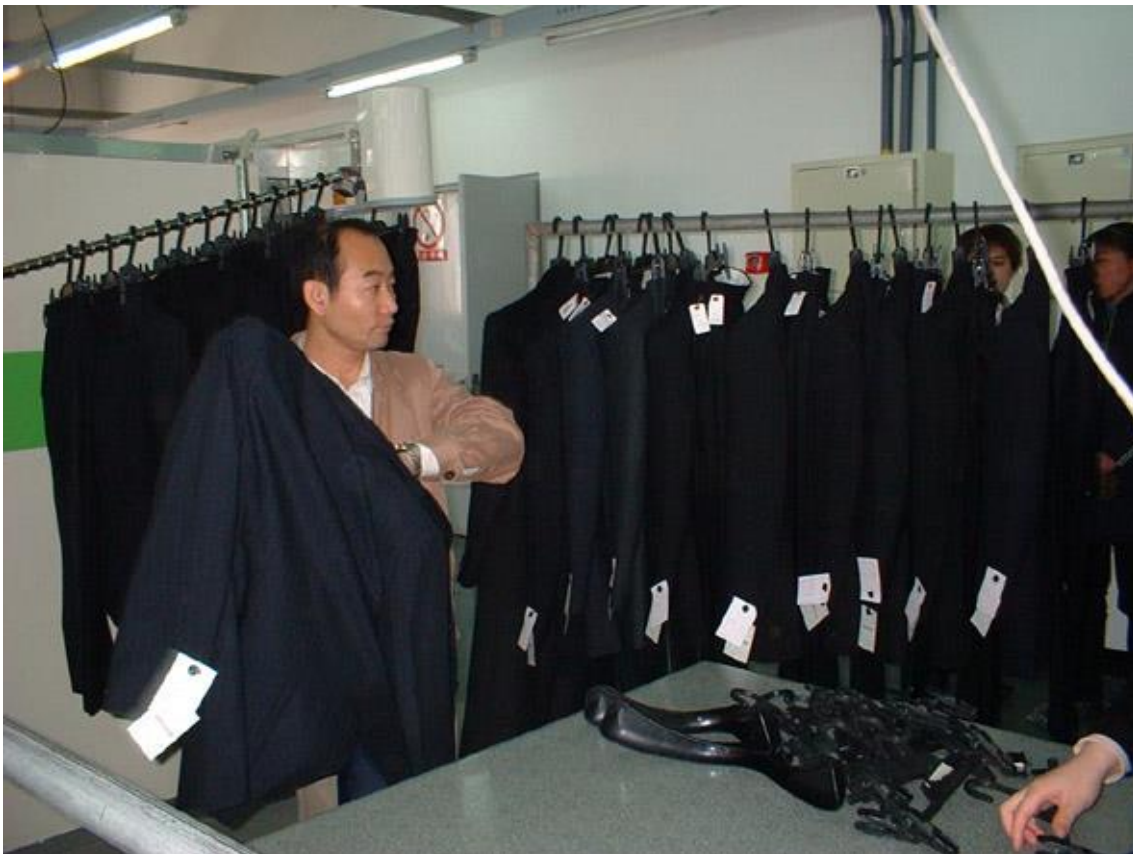
▲③耐熱ハンガーにセット