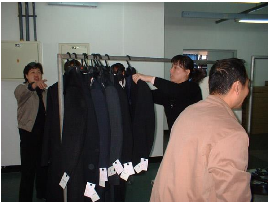
▲④ハンガーラックにセット