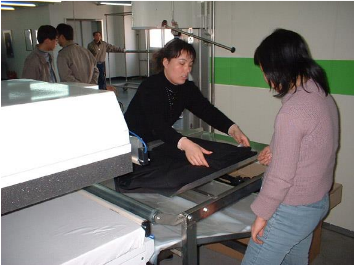
▲⑨熱乾燥処理が終了した上衣をトレイ上に置く