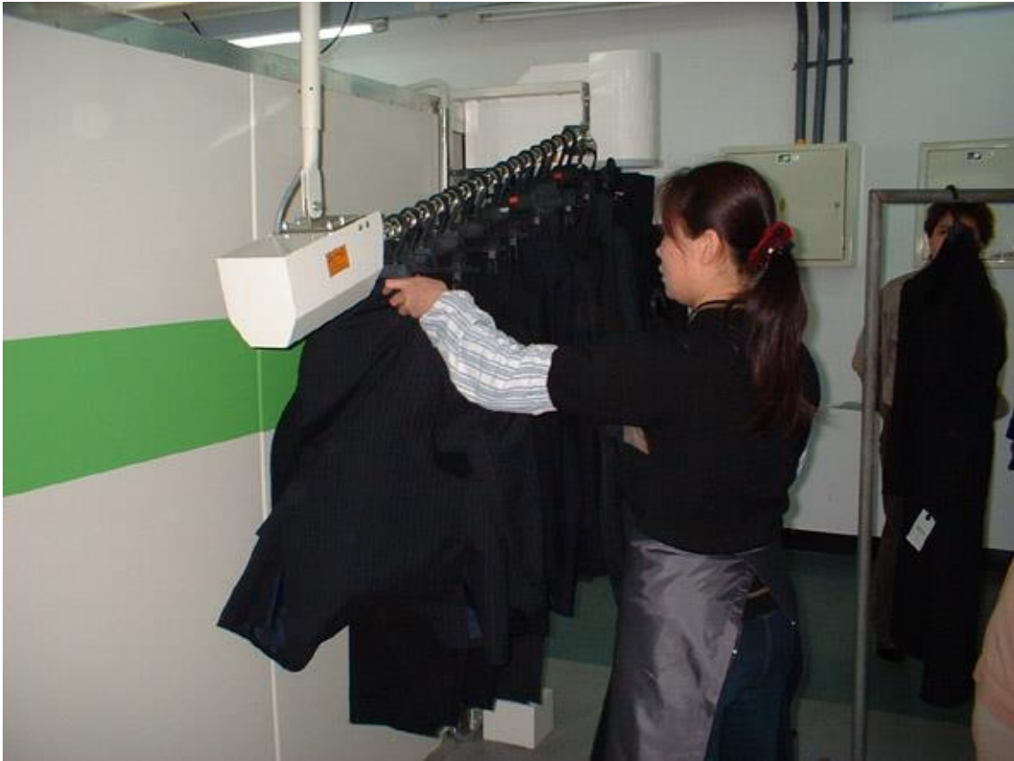
▲⑤乾燥装置の投入装置にセット