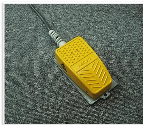
◆フットスイッチ(センサー内蔵) 製品のセットしスタート時に両手で保持が必要な工程に便利です!